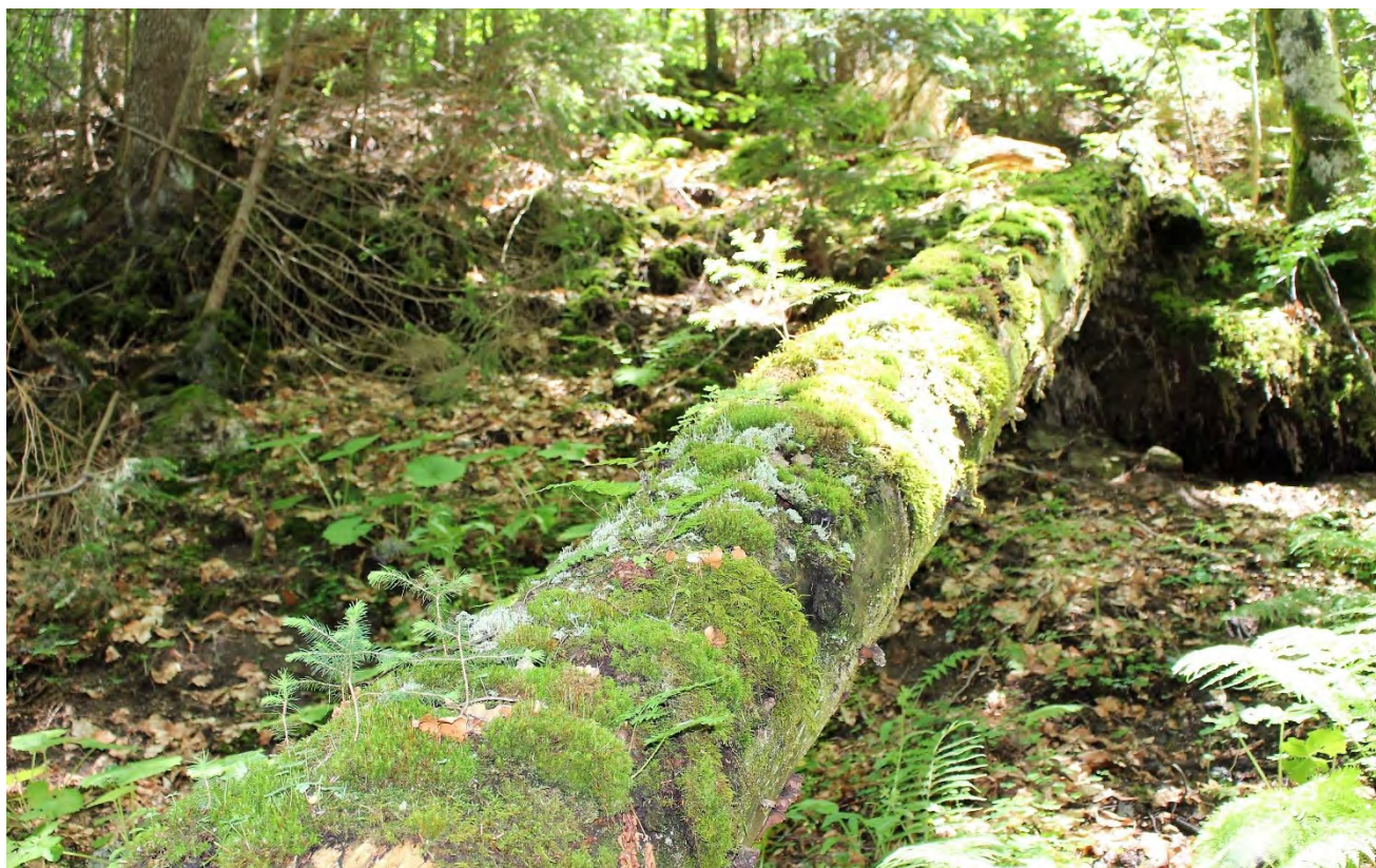
Резерват „Парангалица“.