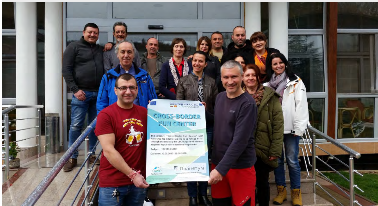
Среща по проекта СВФС.

услуги, базирани на интерпретация на природното и културно наследство.