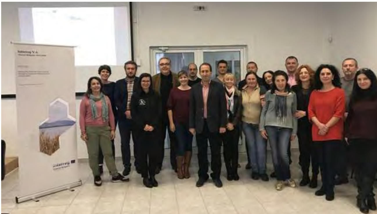
Екипът на BIO2CARE с кмета на Община Нестос по време на Началната среща