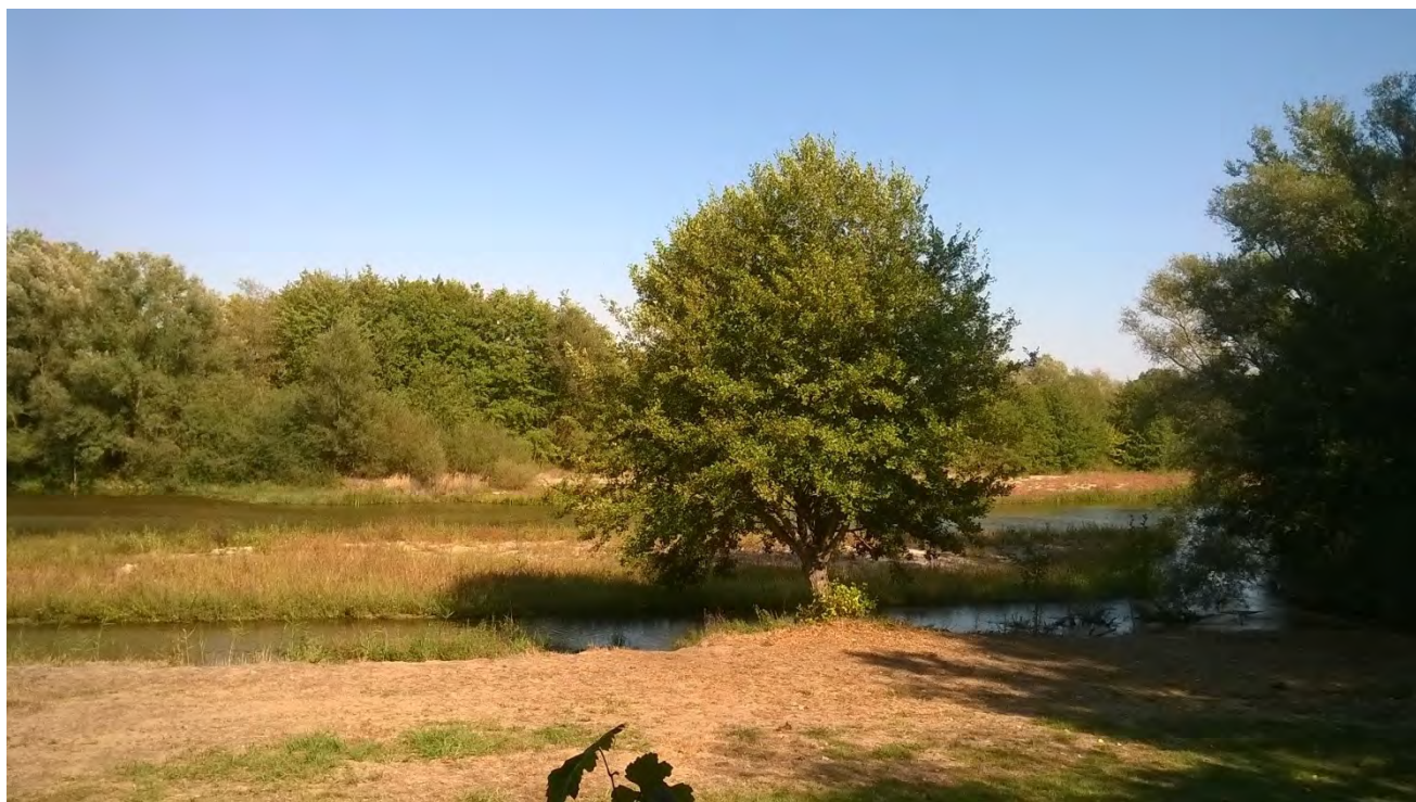
Река Места.