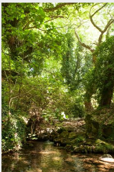
Река Места, Общ. Нестос

Project co-funded by the European Union and National funds of the participating countries