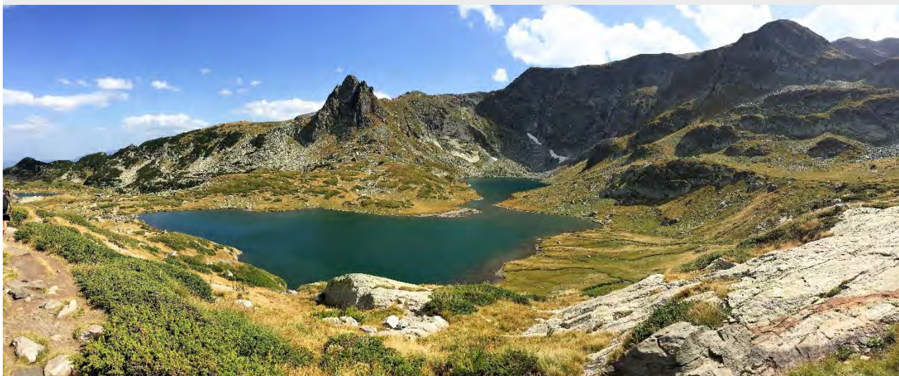
Седемте рилски езера.

страна, която може да се ползва поотделно или заедно в трансграничния регион. Тези три елемента вътрешно ще се хранят едни други. D.4, D.5, D.6 ще хранят DSS. Уроците, научени по време на изпълнението на BIO2CARE и научните резултати от проучванията ще формират продукт D.7, който ще бъде консултиран с местни, регионални и национални власти в последния етап от проекта.