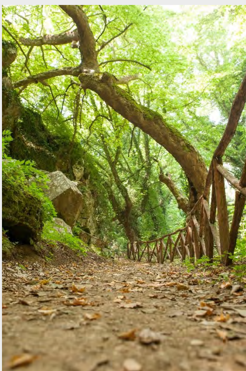
Влажна гора, река Места, Източник: Община Нестос

ЮЗУ – Благоевград, ПП8, изпълнява няколко паралелни проекта, свързани с по-доброто управление на околната среда. Един от тях се нарича „Зелена помпа“ и също се финансира от Програмата Интеррег V-A Гърция-България 2014-2020 г. Водещ партньор е Аристотеловият университет в Солун, а другите партньори са Технологичният образователен институт на Централна Македония, Института по технологии на Източна Македония и Тракия – Департаментът по бизнес администрация, община Пилеа-Хортиатис и Община Петрич. Целите на проекта включват по-добро управление и ползване на водите въз основа на иновативен подход за ограничаване на строителните работи и намаляване въздействието върху водите и околната среда.