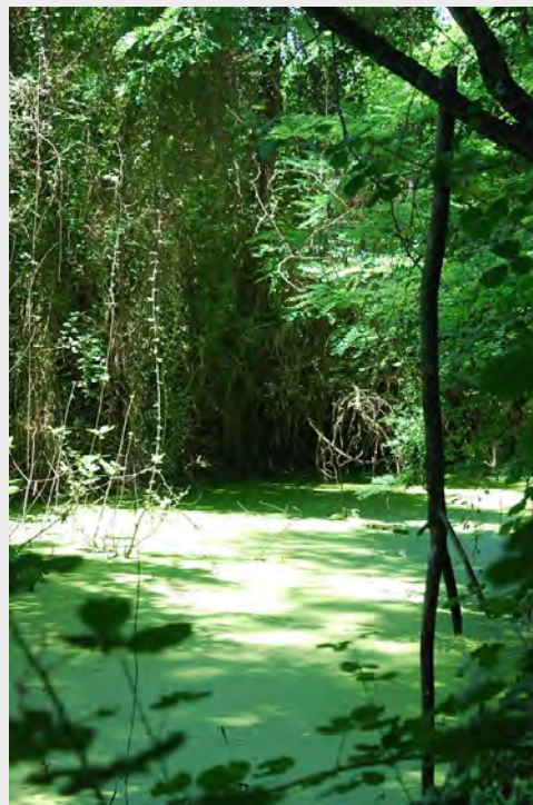
Река Места, Общ. Нестос

Защитените територии покриват около 40% от територията, за която отговаря РИОСВ – Благоевград. Управленските дейности са насочени към ясни и преки ползи за природата и местното население.