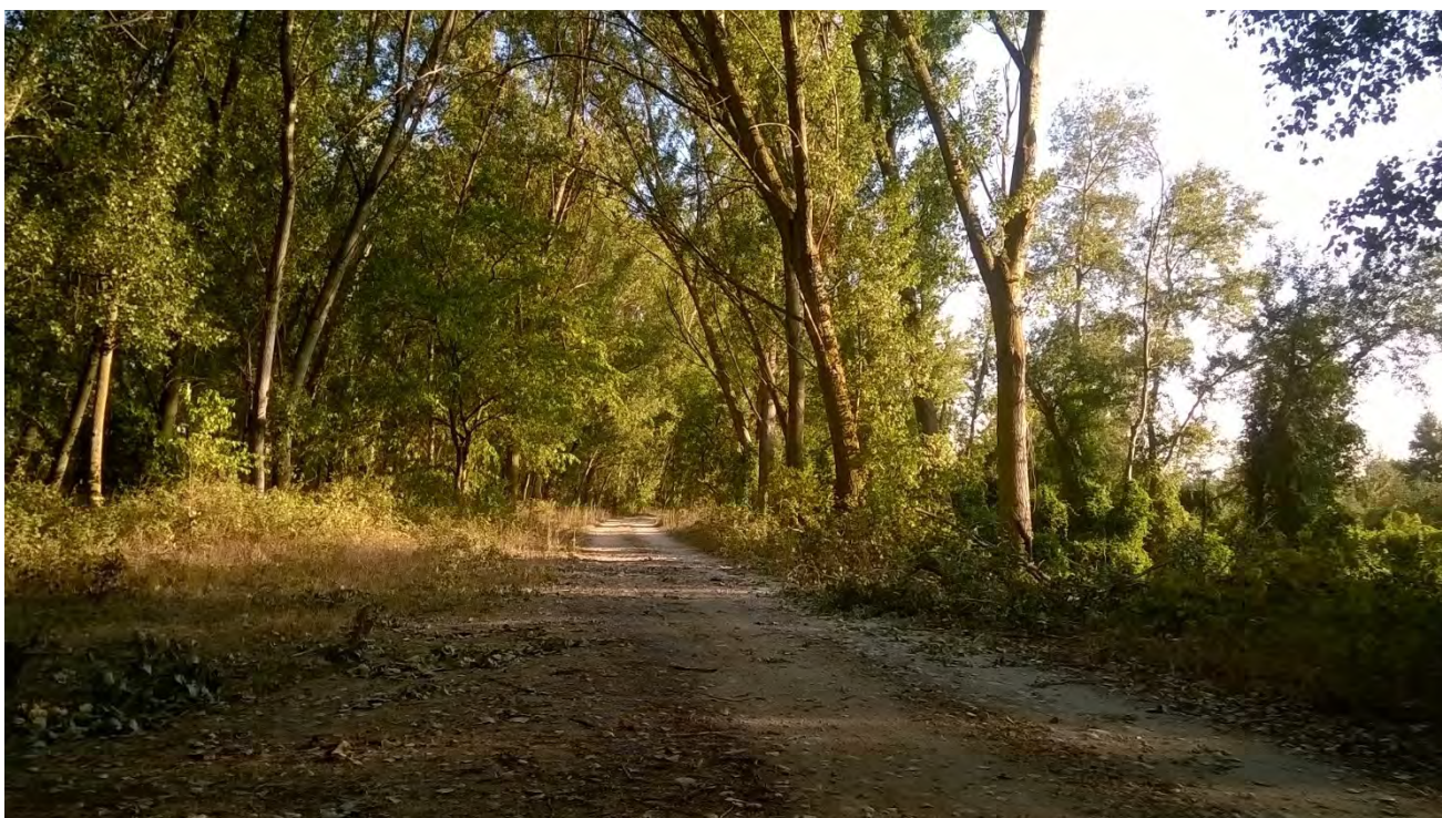
Влажна гора, река Места.