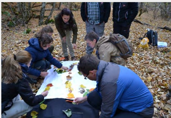
Обучение на природни водачи

ПТФ (ПП9) започна нов проект, финансиран от Германската федерална фондация за околна среда (DBU), с участието на двама немски партньори: малката компания за природозащитна комуникация „Теролог“ и ВТЕ – консултантско обединение за устойчив туризъм.