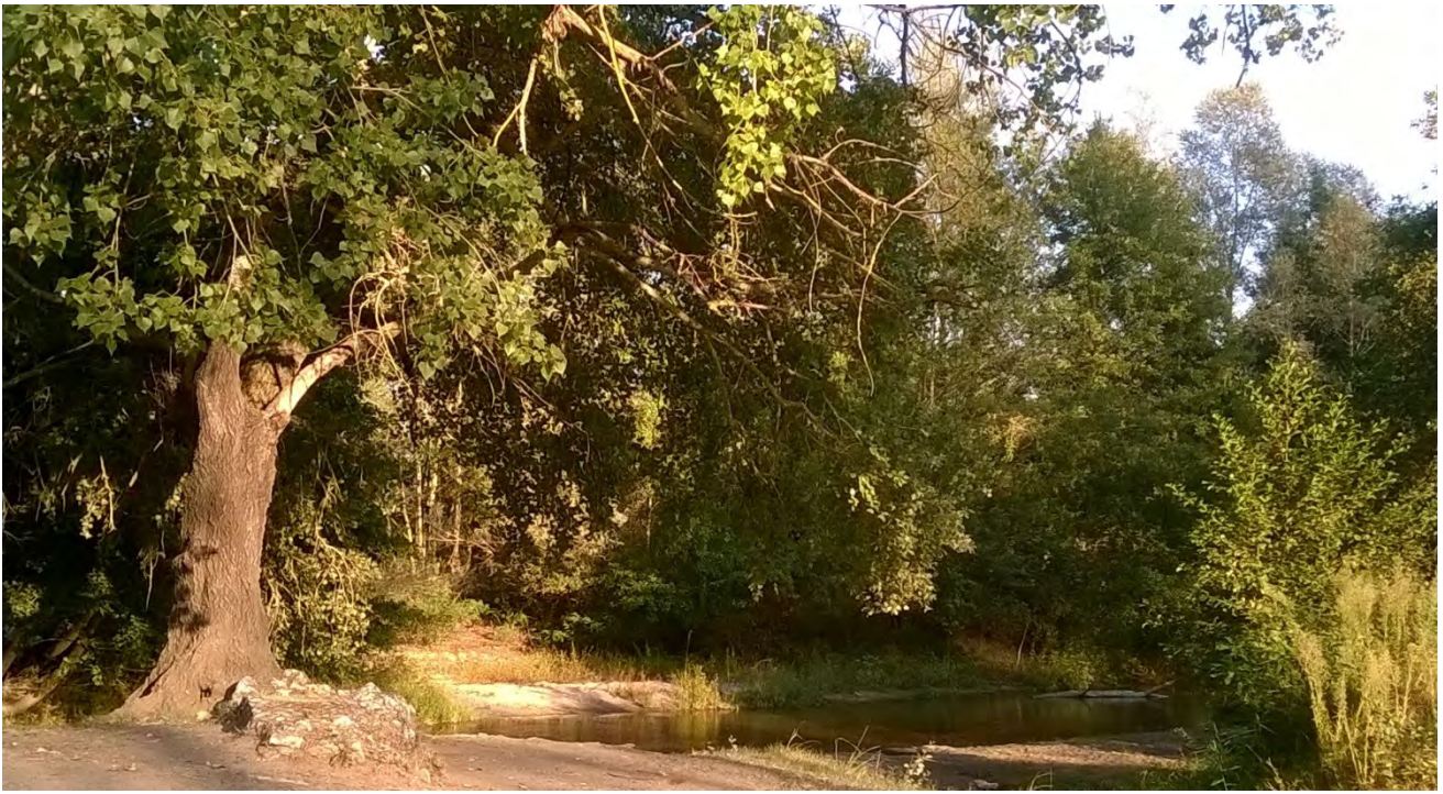
Влажна гора, река Места.

Тъй като проектът BIO2CARE е фокусиран върху промяната, в края му се очакват значими положителни въздействия върху управите на двете защитени територии и техния капацитет, както и върху местните бизнес общности.