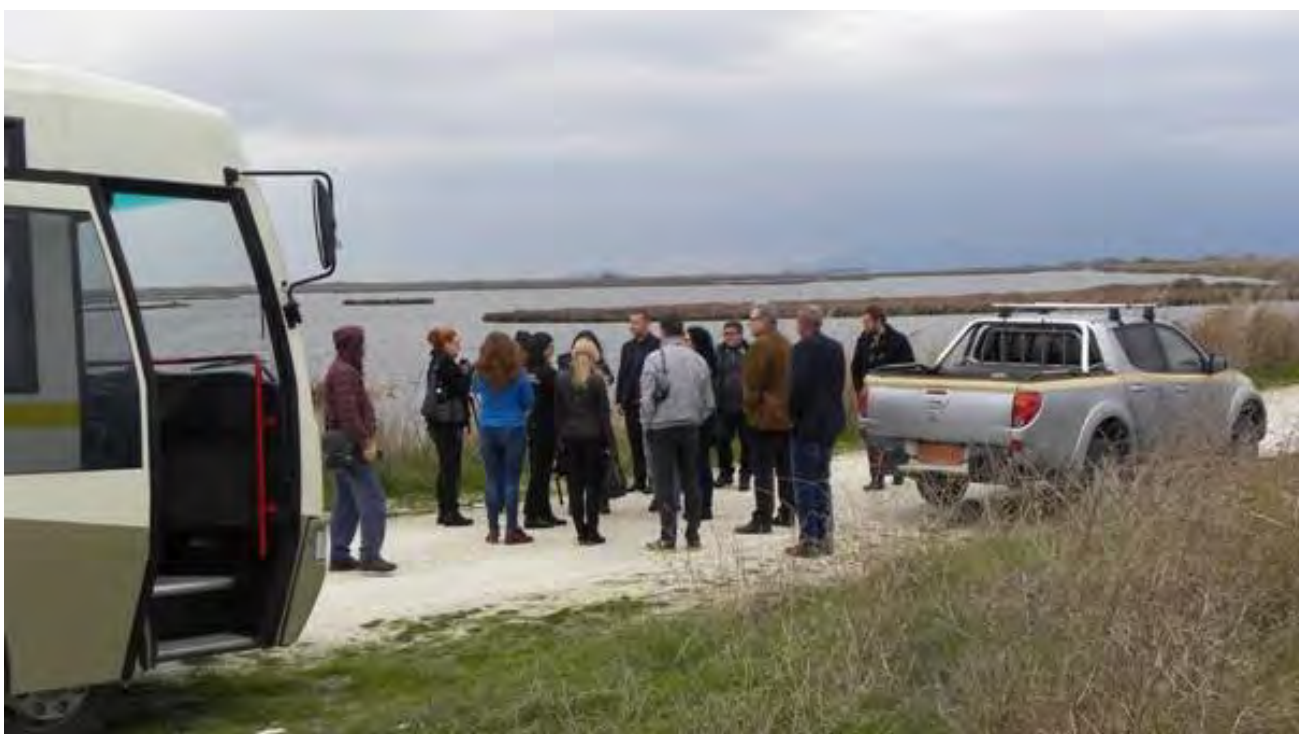
Началната среща завърши с опознавателно пътуване, по време на което партньорите имаха възможност да посетят Информационния център на Делтата на Места в Керамоти, да се запознаят с естествените местообитания в Националния парк „Източна Македония и Тракия“ и да наблюдават птици.